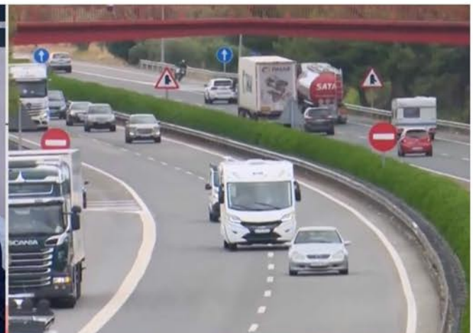
+ EL TRAM DE L'EBRE DE L'AP-7 Cada vegada que hi ha un accident a l'AP-7 la via queda totalment col·lapsada i de retruc la N-340